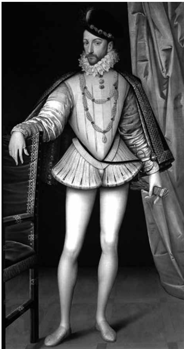
Již tenkrát se všichni, včetně mužů, snažili o štíhlý pas. Minisukně 20. století nejsou tedy žádnou novinkou, právě tak jako „holé“ nohy v punčochách. Nepřipomíná vám to dnešní módu legín?