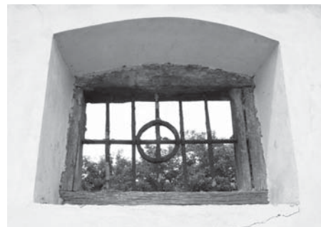
Hodnotná je rovněž řada dochovaných výplňových prvků.

doporučujeme zřizovat v prosté tradiční architektonické podobě, v drobném měřítku a z přírodních materiálů. U dochovaných autentických průčelí je žádoucí respektovat původní omítky, zejména vápenné a dodržovat správný technologický postup při jejich opravě a nových. Výplňové prvky