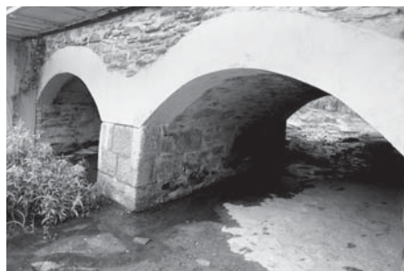
Kamenný dvouobloukový most přes říčku Rokytku byl postaven kolem roku 1871.

V rámci úprav komunikací na území historického jádra obce je třeba doporučit použití tradiční kamenné dlažby. Na vybraných místech (např. v okolí vodní nádrže) doporučujeme použít mlatové povrchy pěších komunikací (např. i na dalších komunikacích drobného významu i v rámci velkých statků). Součástí rehabilitace by mělo oživení původního přirozeného charakteru koryta Rokytky. Z jejího břehu je žádoucí odstranit nevhodné na-