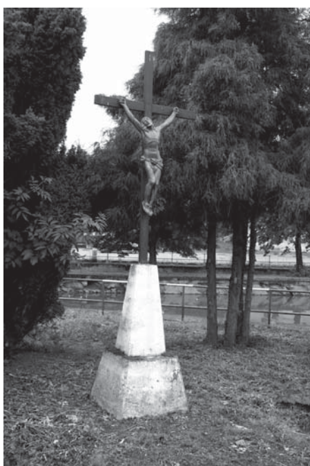
Křížek na břehu rybníka, pravděpodobně z počátku 20. století.

Nejstarší zástavba leží v centrální části obce, ale půdorys jádra obce byl dotvořen až na počátku 20. století. Podstatným zásahem byla výstavba budovy úřadu po roce 1974. Areály