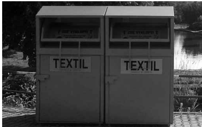
V Nedvězí jsou kontejnery umístěny v ulici Rokytná u rybníka.