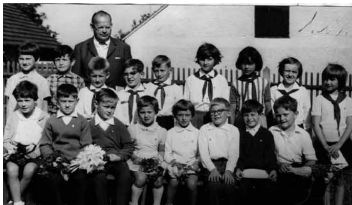
I. a II. třída v r. 1967