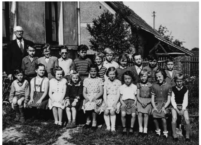
Fotografie žáků z r. 1957

do r. 1884 a na všech místech byly pro obec vyřízeny nepříznivě. Jelikož případ tento byl tak zvláštního druhu, že není o něm v zákonech jasněho rozluštění, objevovaly se stále rozličné námitky, které k novým vedly protestům, a tak vlekla se věc donekonečna a kdo ví, jak dlouho by trvala, kdyby obecní zastupitelstvo nebylo ji dobrovolně ukončilo. Dne 8. března 1884 odebral se starosta p. V. Škorpil č. 29 s p. Janem Rathouským č. 7 k zemské školní radě, aby se otázali, jak velkou subvencí zemskou může obec očekávat. V nepřítomnosti předsedy z.š.r. mluvili se 2 členy z.š.r., kteří je ujistili,