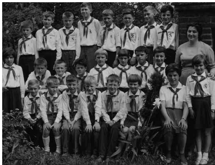
Fotografie třídy z r. 1964