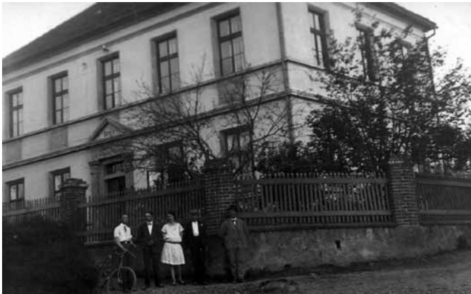
Škola v Nedvězí